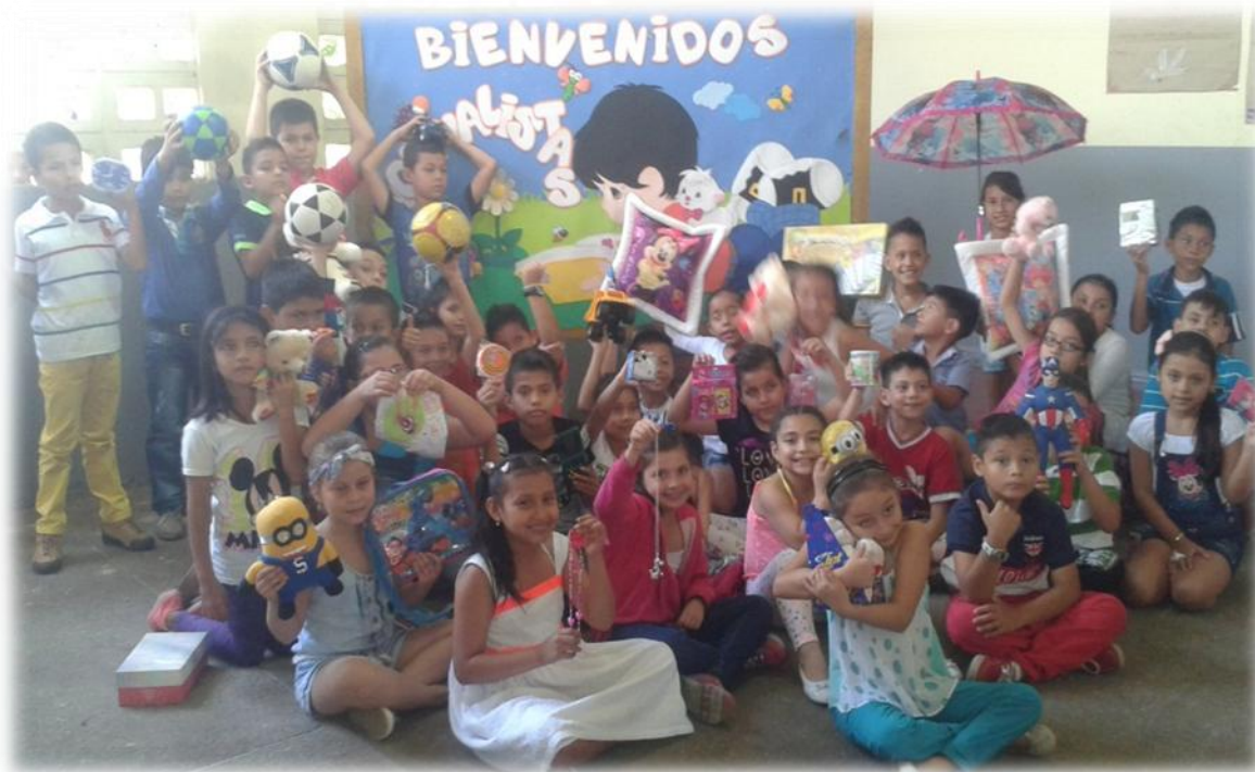
Finalización de la actividad de la entrega de regalos

Integración desarrollada en las dos últimas horas de la jornada escolar en el aula de clase, actividades como estas aumentan las relaciones interpersonales entre estudiantes y maestros.