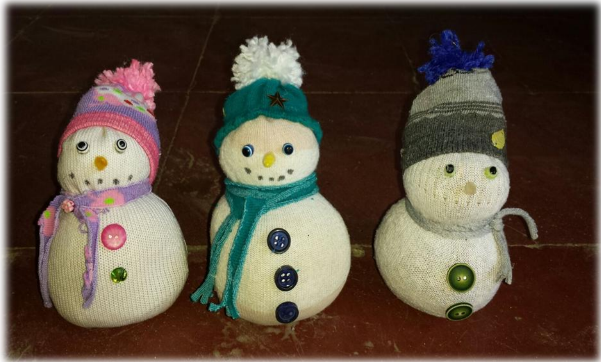
Algunos de los muñecos realizados por los estudiantes

Con esta manualidad se reflejaron bastantes aspectos positivos para la construcción de una cultura de paz como el compartir materiales, ayuda contante para que el trabajo de los demás compañeros quedaran bien hecho y el cuidado del ambiente en el que estaban.