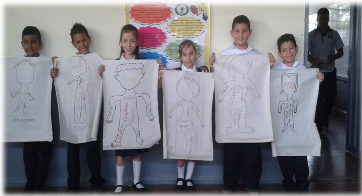
Exposición de algunas siluetas trabajadas en parejas.

Esta actividad se desarrolló con el fin de disminuir el rechazo o empatía entre los estudiantes, la cual tuvo como resultado el reconocimiento por parte de los estudiantes sobre las cosas que nos hacen ser iguales y las que nos hacen ser diferentes en este caso nuestros valores y deberes.