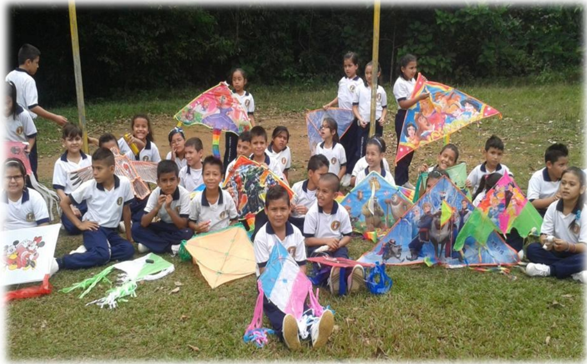
IMAGEN 5: Salida recreativa día de las cometa

Llegada a la zona verde en la que se desarrolló la integración