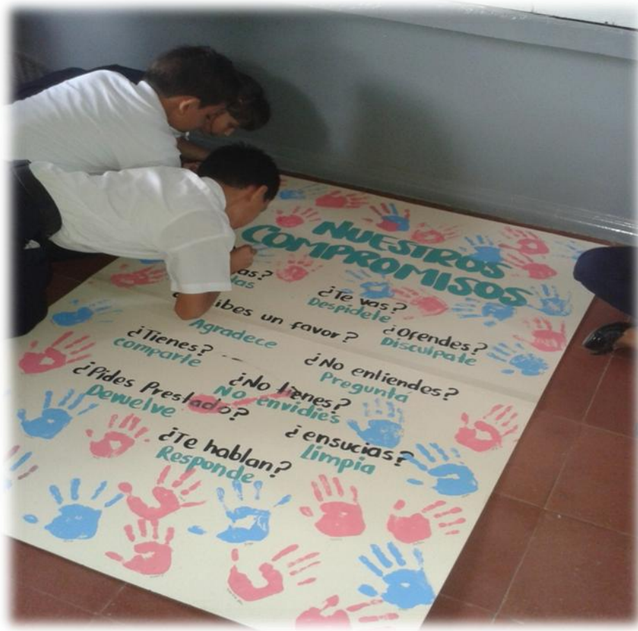
Ejecución de la actividad “Mis compromisos” dentro del aula de clase

La utilización de estrategias didácticas o manualidades ayudan a la disposición para la construcción de compromisos y el cumplimiento de normas básicas de comportamiento.