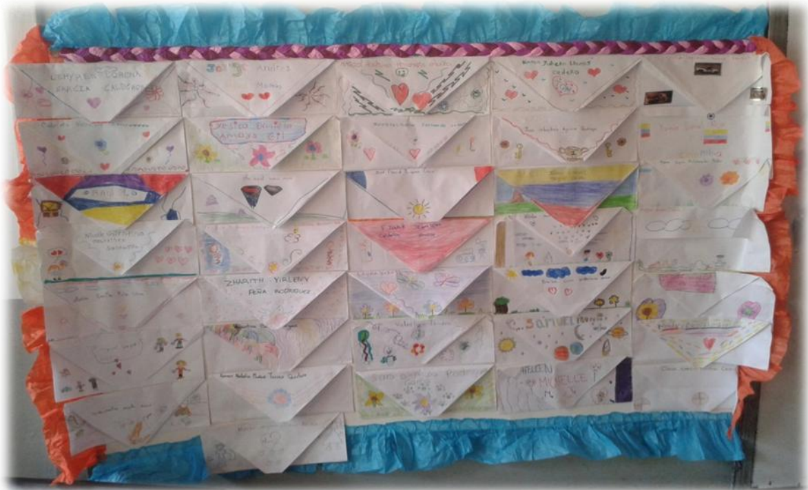
Cartel “El buzón de la amistad” ubicado en el aula de clase

Es importante la utilización de diferentes estrategias que faciliten y aumenten la expresión afectiva en los estudiantes como los mensajes de valoración y agradecimiento que permiten fortalecer el autotestiesma y la confianza en sí.