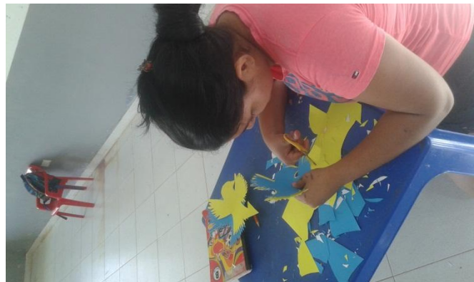
Preparación del vestuario de los niños para la presentación