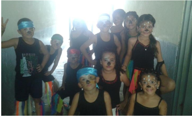
Danza el Garabato