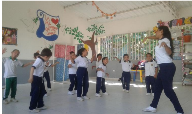
Rumba terapia-Ensayo de la Obra de teatro