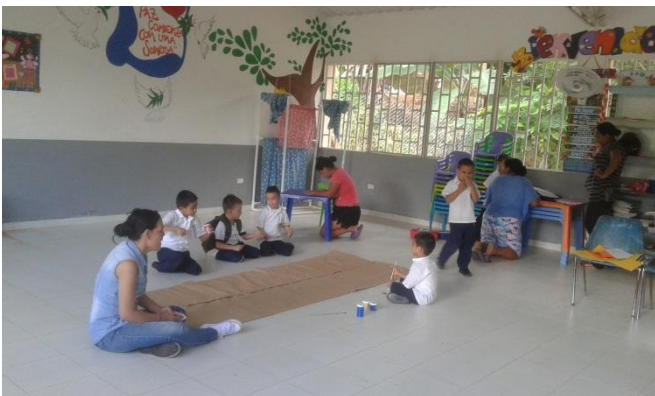
Trabajo manual con los padres de familia