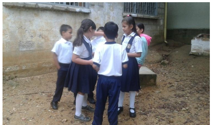
Ensayos de las obras de teatro