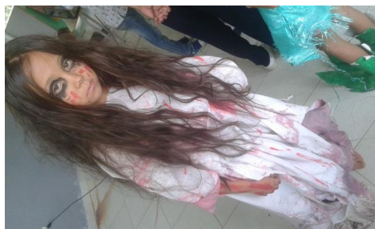
Obras de teatro-Mitos y Leyendas