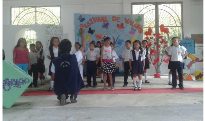
Coro de niños- Canción Siempre de Mago de Oz