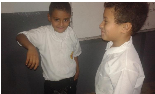
Actividad del espejo