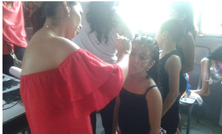
Trabajo con los padres de familia