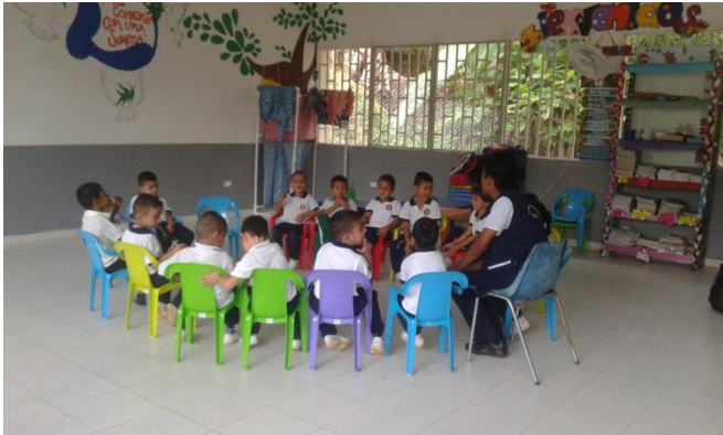
Taller de calentamiento vocal-Canción de colores