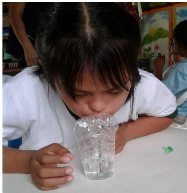
Terapia de lenguaje (manejo de la respiración)