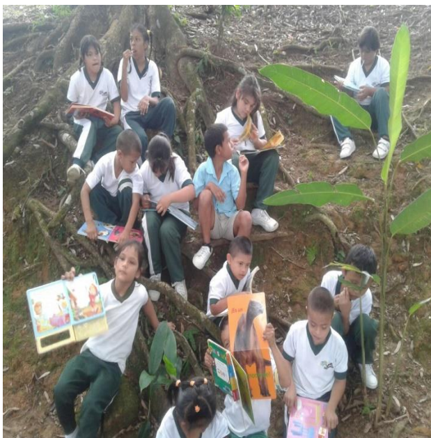
Lectura de imágenes en espacio abierto