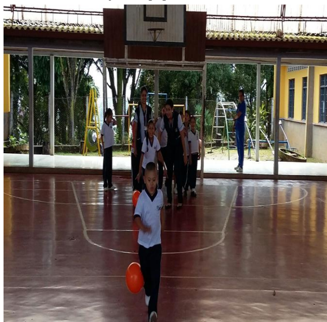
Actividades de coordinación y trabajo en equipo