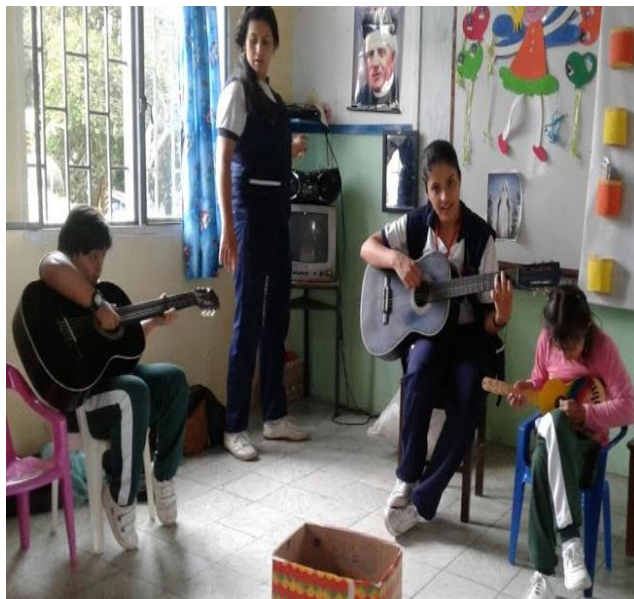
Fortalecimiento de la habilidad de escucha a través de la música