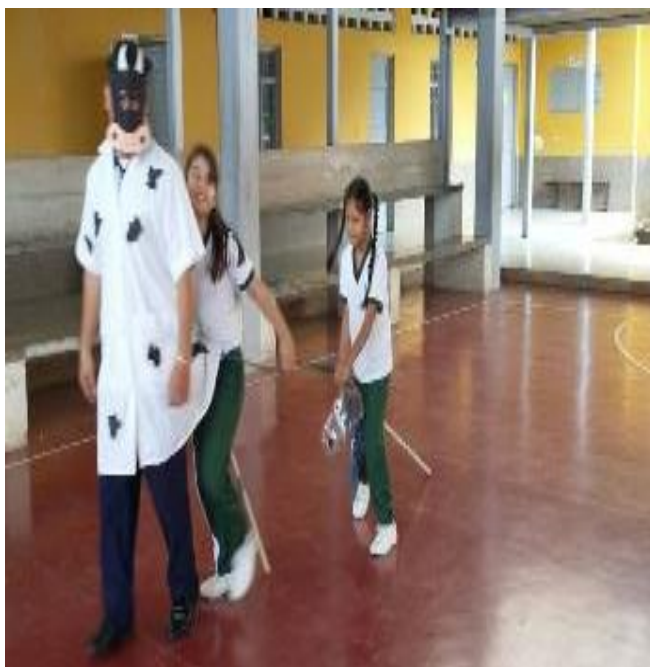
Tiempos de recreación y aprendizaje (región Orinoquía- El coleo)