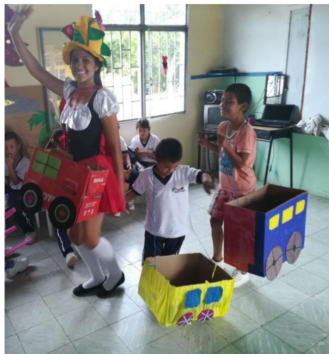
Festival de los valores (actividad de cierre)