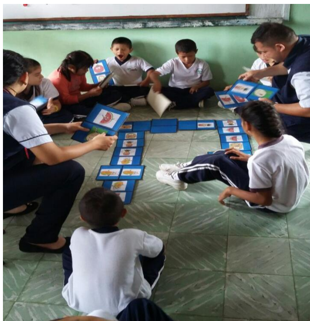
Actividades de razonamiento visual