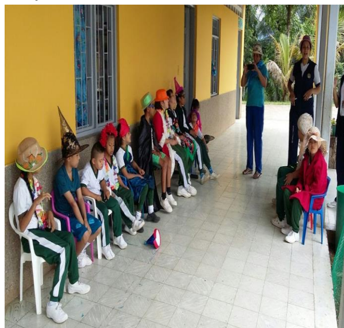
Expongo mi talento (para mejorar las relaciones personales y la confianza en sí mismo).