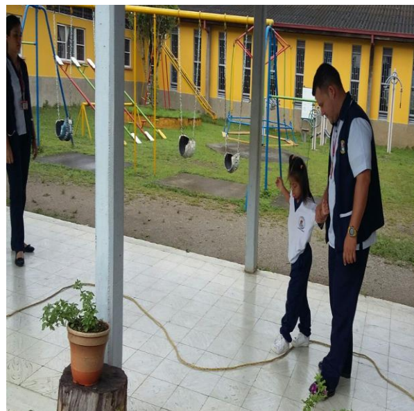
Seguimiento de patrones (motricidad gruesa)