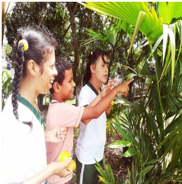
Exploración del medio usando los cinco sentidos