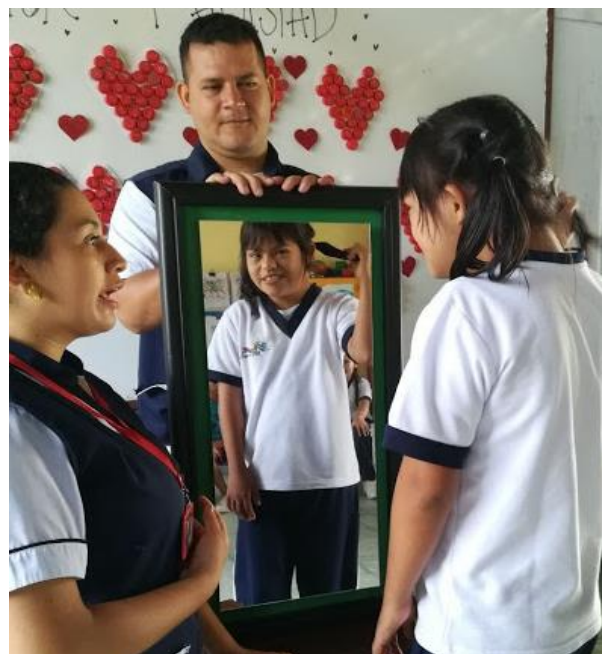
Reconocimiento de sí mismo (Mi identidad)