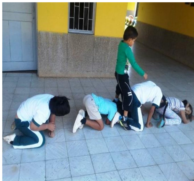
Actividades de motricidad gruesa y trabajo en equipo