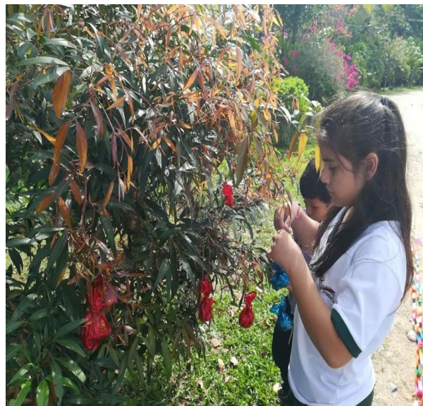
Explorando el medio a través de manualidades artísticas